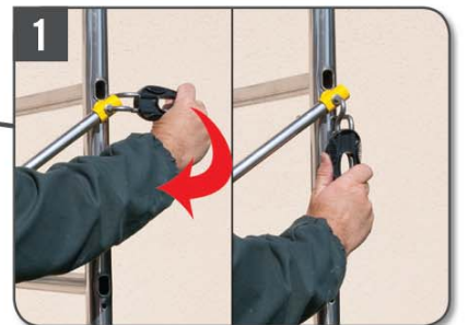
Un quart de tour suffit pour fixer lisses et diagonales.