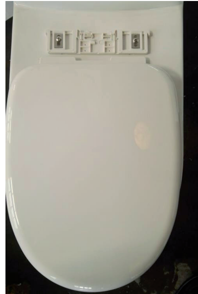
Insérer l'abattant dans les vis de fixation. Ajuster la position de l'abattant puis serrer les vis avec un tournevis.