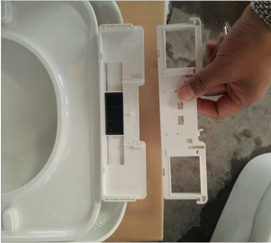
Retirer la platine de fixation de l'abattant.