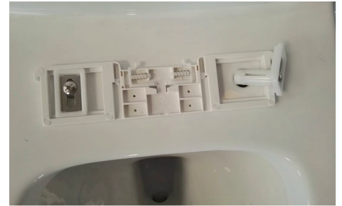
Mettre en place les vis de fixation au travers des trous de la cuvette.