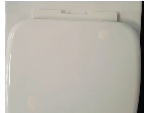
Emboîter le cache sur la platine.