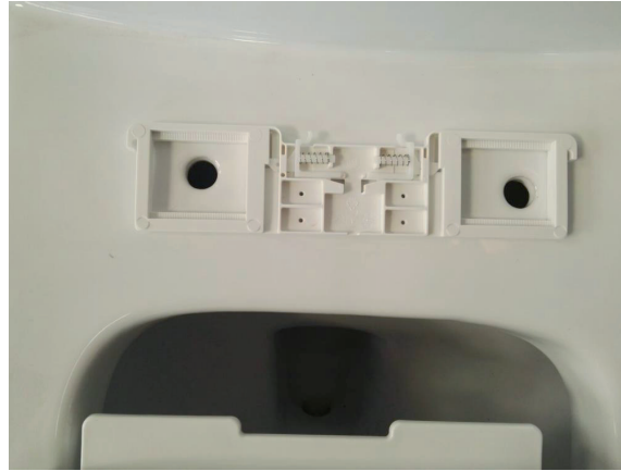
Placer la platine sur la cuvette du WC.